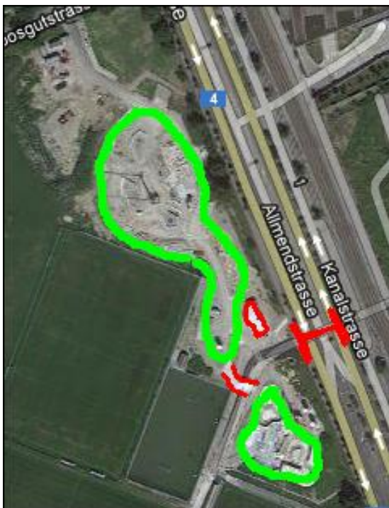
Bild 5 - Übersicht Freestylepark

Die freigegebene Fläche ist riesig und wartet darauf, kreativ gestaltet zu werden.