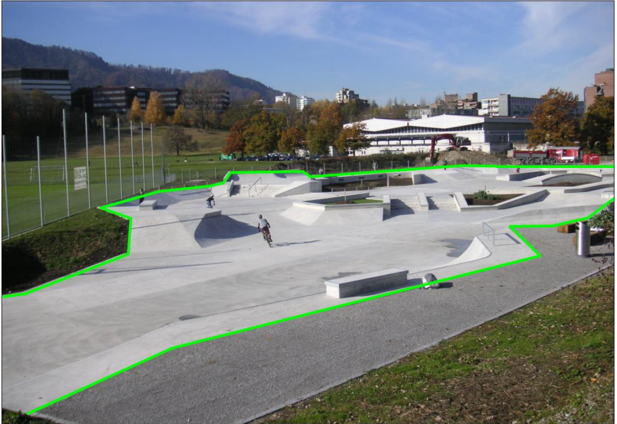
Bild 2 - nördlicher Teil der Anlage