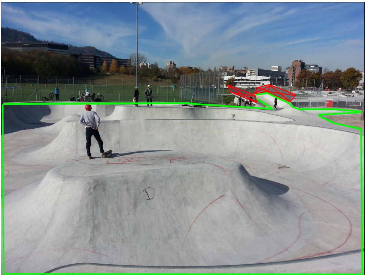
Bild 1 - Pools im südlichen Teil der Anlage

Die grün umrandeten Flächen werden freigegeben, die rot markierten Flächen bitte nicht besprayen.